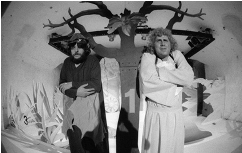
«Adam und Eva» par le Claque Baden, 25.09.1974