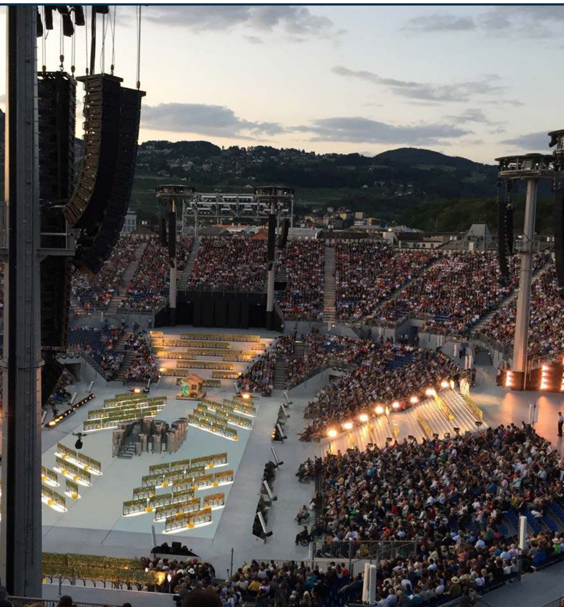
Fête des Vignerons 2019, Vevey