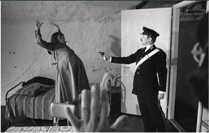
«Bezahlt wird nicht» par le Claque Baden, 01.10.1977