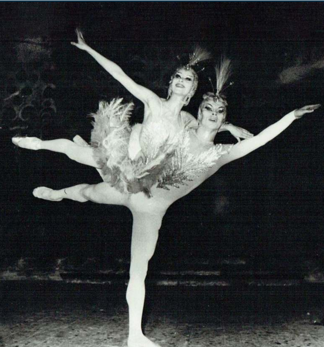
Beatriz Consuelo et Rudolph Noureev dans «L'Oiseau bleu», 1961