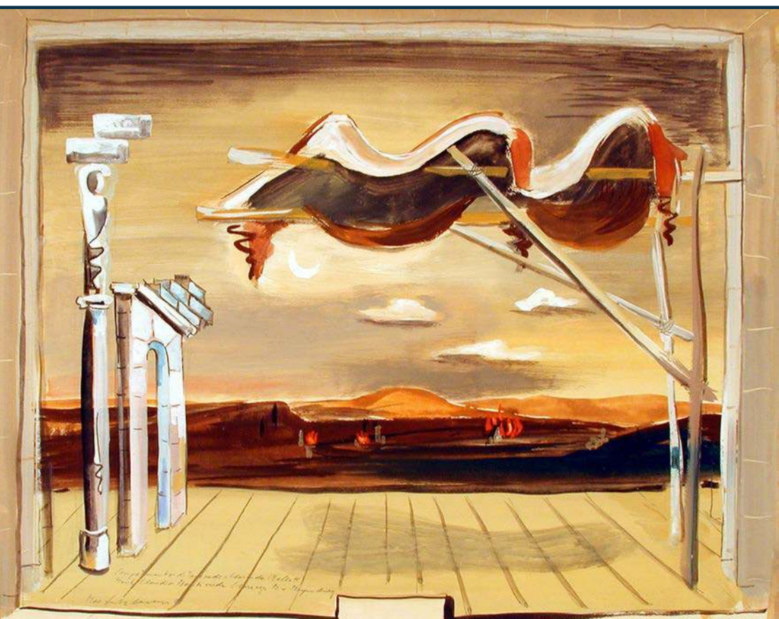
Max Sulzbachner, Il Combattimento di Tancredi e Clorinda, 1941