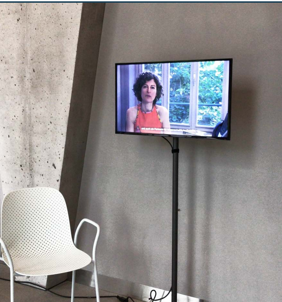
Écran de la Fondation SAPA au nouveau Tanzhaus Zürich