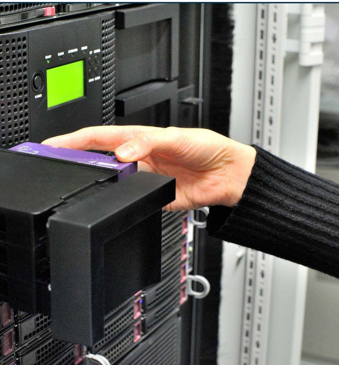
Sortie d'une cassette LTO du support de stockage de la Fondation SAPA