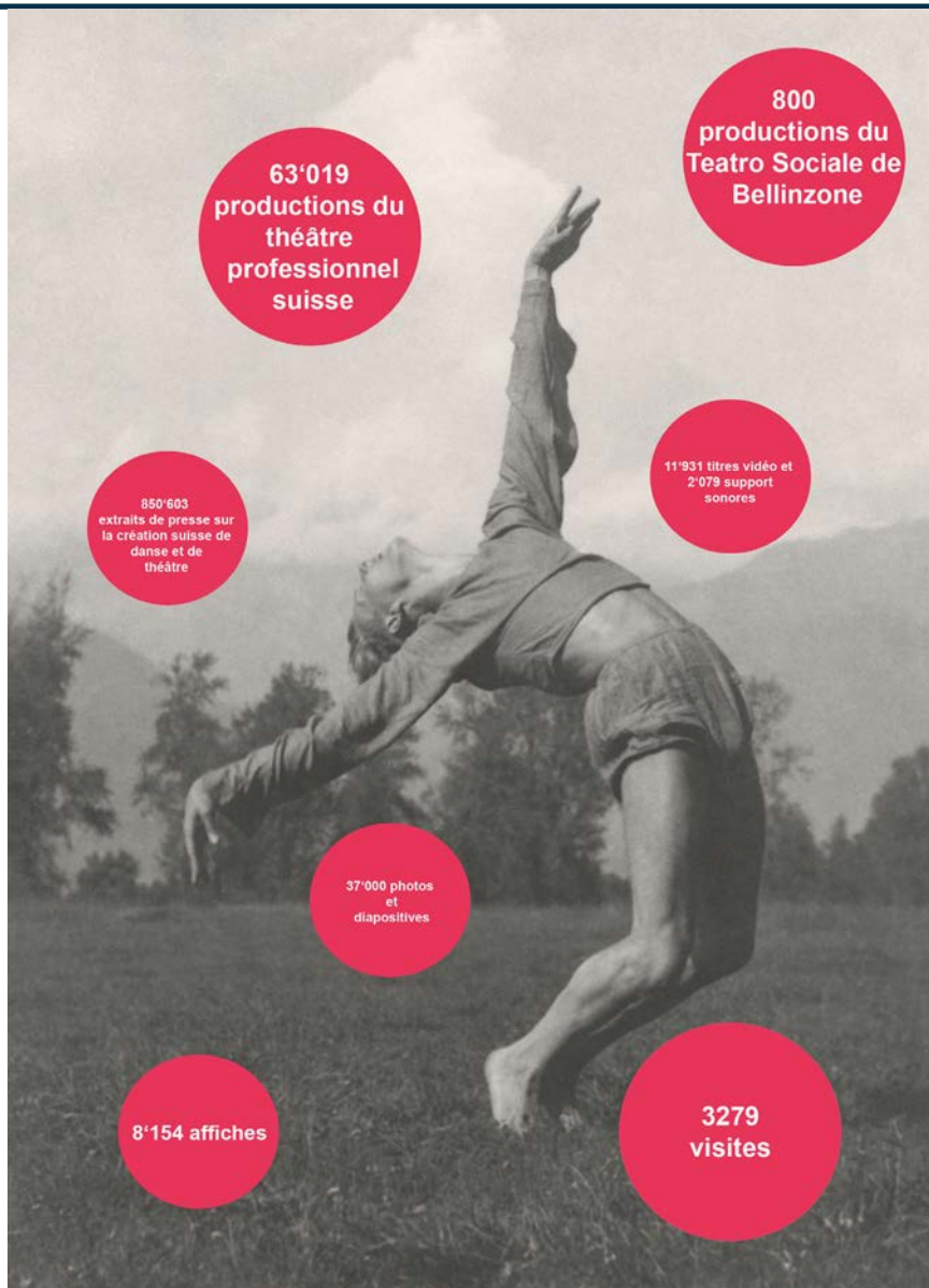
Chiffres-clés de SAPA Photo : Rudolf Opitz, Sigurd Leeder à Ascona, vers 1925