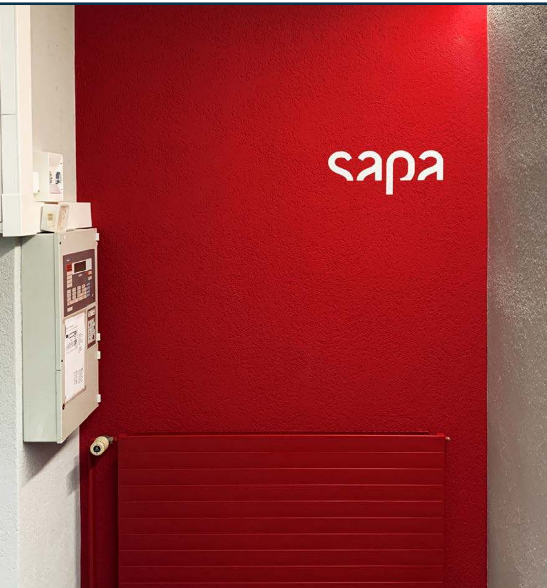
Entrée rénovée du site SAPA de la Schanzenstrasse à Berne